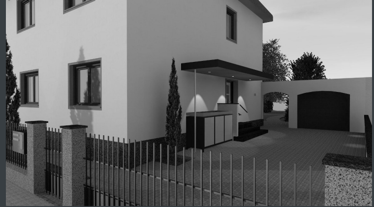
vor der Sanierung / Modernisierung